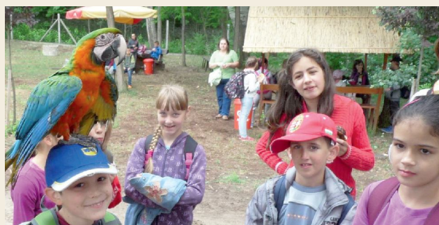
Péntek délelőtt kistigrist és papagájt is simogathattunk a felsőlajosi Magán Zoo állatkertben