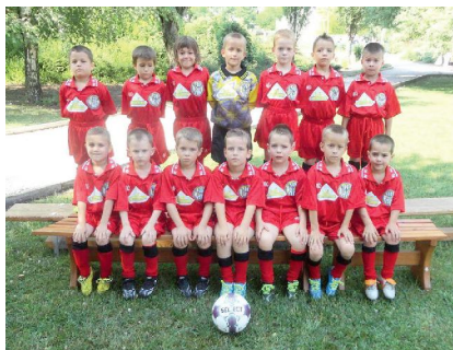
A győztes csapat

Lajosmizse, Attila utca 6. • Telefon: 76/356-560 • E-mail: mizsovi@freemail.hu