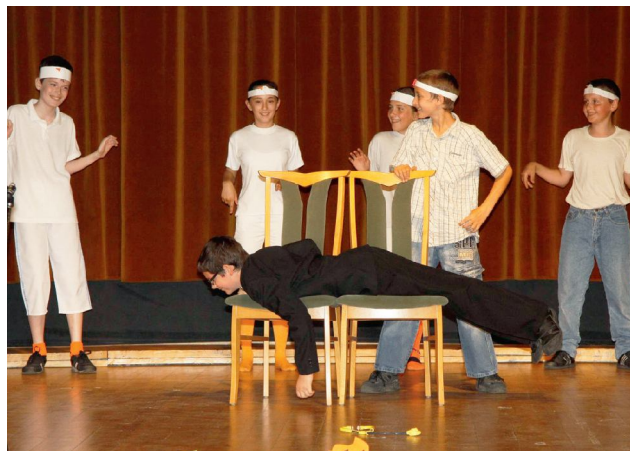
Lúdas Matyi, 6. e osztály

élvezettel nézhette a zenés, a táncos, a prózai, az egyéni és az egyéb különleges előadásokat. A jótékonyági gála nem lett volna teljes a pedagógus tánckar vidám és látványos záró darabja nélkül, amelynek sikeréhez a tánckarba bevett 4 „jó fej” férfi tanár is hozzájárult. Ne feledkezzünk meg azokról a szülőkről sem, akik a díszletek és ruhák elkészítésében önzetlenül segítettek az osztályok és a felkészítő tanárok munkáját. Bátran kijelenthetjük, hogy a tanév utolsó előtti napján a nagy összefogás gálájának lehettünk a résztvevői.