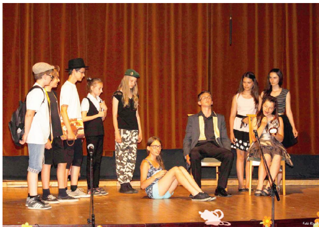
A császár új ruhája, Színjátszó Szakkör

Lajosmizse, Szabadság tér 13. • Telefon: 76/356-156 • E-mail: titkarsag@altisk-lmizse.sulinet.hu • altisk-lmizse.sulinet.hu