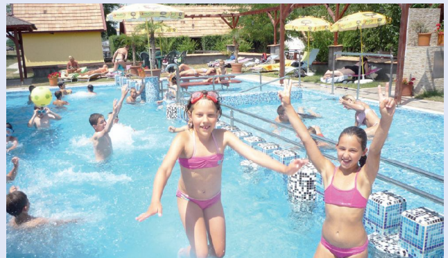
Önfelelt kikapcsolódás a Liza Hotel strandján