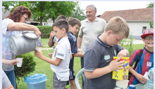
Friss háziej a Kollár tanyán