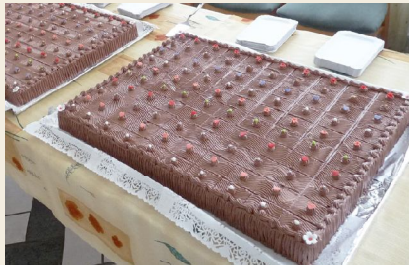
A Sarki Pékség Kft. ajándéktortája

netet mondani az édességet felajánló Sarki Pékség Kft.-nek és természetesen minden osztálynak és osztályfőnöknek a lelkes részvételért.