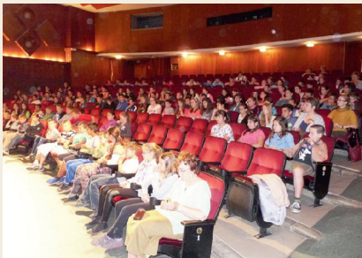
A versenyben legjobban szereplő osztályok osztályfőnökeikkel a döntőn

Május 5-ével lezárult az általános iskolások számára rendezett, három hónapra keresztül zajló vetélkedőnk, a Könyvtári Derbi. A döntőre május 21-én, csütörtökön, 11 órakor került sor. Mivel a gyerekek és tanáruk sok időt és energiát öltek bele a különböző témák köré csoportosított feladatok megoldásába, ezért szerettük volna, hogy a döntő vére menő küzdelem helyett egy vidám, felszabadult örömnappal legyen. A helyezések a fordulókön elért pontszámok alapján dőltek el, de az osztályokat nem tájékoztattuk a pontos eredményről, így a döntőre maradt az izgalom.