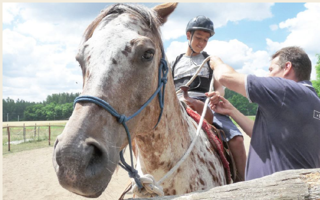
Hetünket a mikebudai Silver Horse Ranchen kezdtük