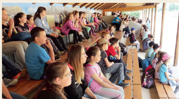
Ezt követően lovas kocsikkal mentünk át a Tanyacsárdába, ahol a finom ebéd után lovasbemutatóval és biciklizéssel zártuk a tábort

Jövőre is várjuk szeretettel a lelkes kis táborozókat! Könyvtárosok