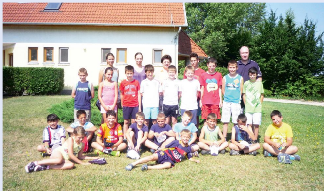
A második turnus