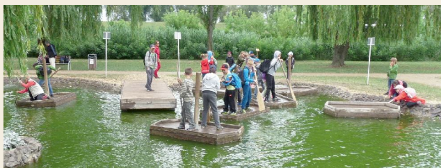
Csütörtökön felfedeztük a Tisza-tavi Ökocentrum érdekességeit és a Kalandsziget kalandparkban próbára tettük bátorságunkat