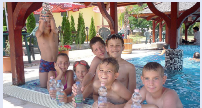
Vízben a Magyarvízzel