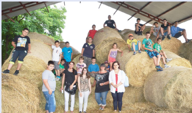
Bálamászó verseny a Kollár tanyán